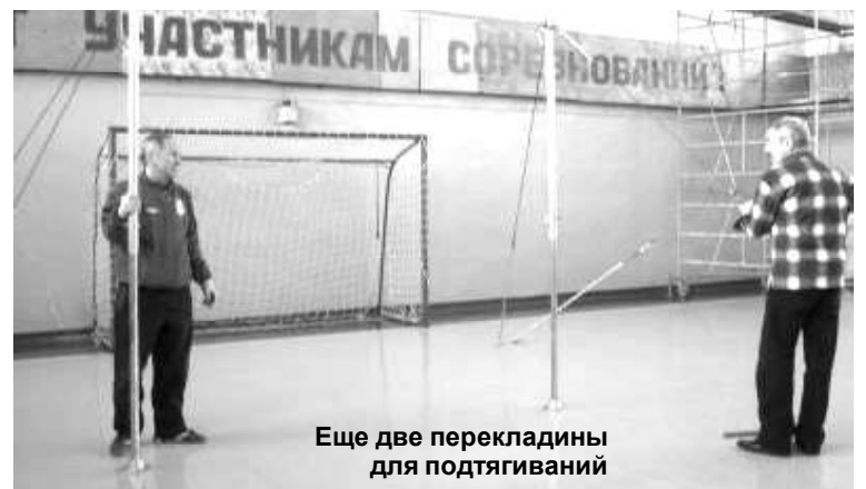
Еще две перекладины для подтягиваний

области. Они будут награждены кубками, медалями, денежными призами и дипломами губернатора области.