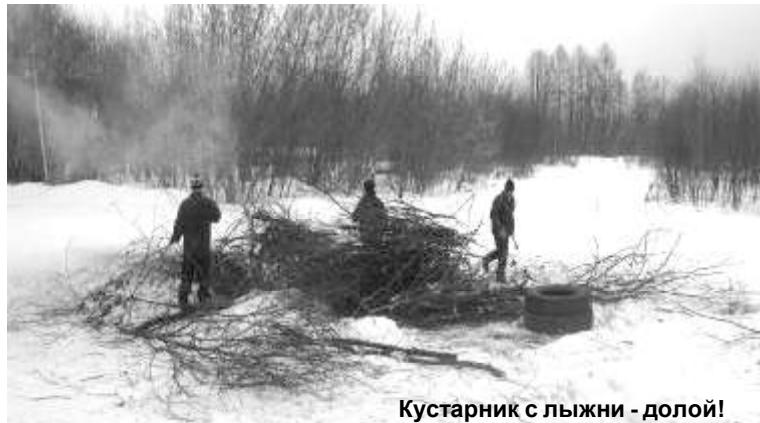
Кустарник с лыжни - долой!

Уже скоро в Мантурово съедутся более 500 спортсменов, главы городов и районов, первые лица области. Готовы ли мы принять гостей?