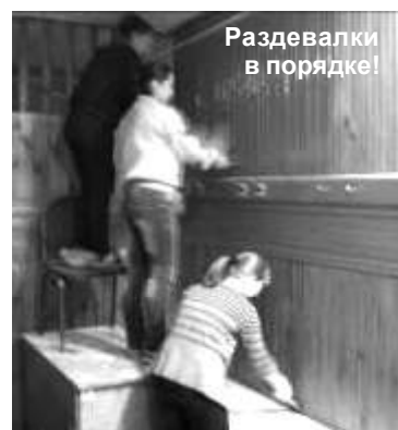
Раздевалки в порядке!

Молодежный центр засиял новой подсветкой, каток у лица в действии, сувенирная продукция в печати.